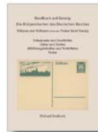
Deutschland * vor 1945