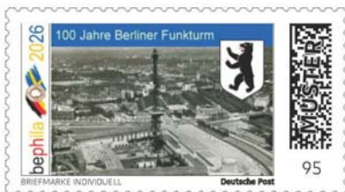
100 Jahre Berliner Funkturm

Zu den Jubiläen der Ausstellung stellen wir die folgenden Briefmarken Individuell vor: