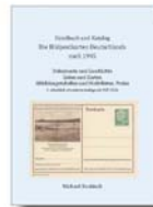
Deutschland * nach 1945