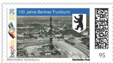
100 år Berlins radiotorn

I samband med utställningens jubileum presenterar vi följande individuella frimärkena enskilt: