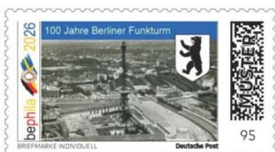
100 years of the Berlin Radio Tower

To mark the exhibition's anniversary, we are showcasing the following personalised stamps: