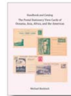
Die ganze Welt außerhalb Europas