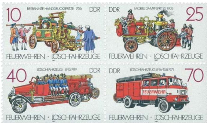
Die DDR würdigte 1987 mit der MiNr. 3101–3104 die Arbeit der Feuerwehr in einem Viererblock mit Löschfahrzeugen aus zwei Jahrhunderten.

Als nach dem Krieg Deutschland geteilt wurde, entwickelte sich in der DDR, entsprechend in Ost-Berlin, der Zwei-Fahrzeug-Zug, später mit Voraus-Fahrzeug. Hier mussten anfangs die aus der Kriegszeit überkommenen Fahrzeuge weiterverwendet werden, bis um 1953 eine eigenständige Industrie entstanden war. In der DDR ergab sich eine völlig einheitliche Ausstattung aller Feuerwehren, weil über lang nur noch drei Fahrzeuge produziert wurden, Löschfahrzeug und Tanklöschfahrzeug auf W 50 L-Fahrgestellen, dazu als Voraus-Löschfahrzeug der Barakas B 1000.