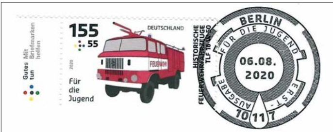
Auf der Ausgabe für die Jugend 2020, Bund MiNr. 3557–3559 sind drei langjährig im Feuerwehrdienst genutzte Löschfahrzeuge abgebildet.

Bei allen Fähigkeiten auch zu ungewöhnlichen Brandeinsätzen und noch mehr Können bei Einsätzen technischer Hilfeleistung wird das Alltagsgeschehen vom Rettungsdienst beherrscht.