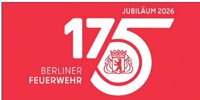
Logo „175 Jahre Berliner Berufsfeuerwehr“.

Der Januar 2026, geprägt von Stromausfall im Südosten Berlins und Glätte in der ganzen Stadt, war mit 51 259 Einsätzen laut Tagesspiegel der „einsatzreichste Monat in der Geschichte der Berliner Feuerwehr“. Es kam zu mehrfachen Ausnahmeständen und 1,15 Einsätzen pro Minute!!!