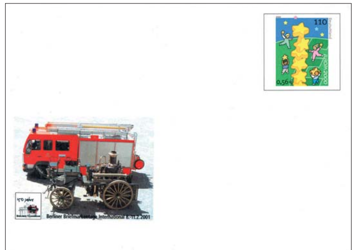
150 Jahre Berliner Feuerwehr wurden anlässlich der Berliner Briefmarkentage International vom 8. November 2001 auf dem Plusbrief MiNr. U50 19 mit einem Zudruck gewürdigt. Natürlich auch auf der im selben Jahr durchgeführten Bephila 2001 mit einem Artikel im Ausstellungskatalog.

Bei allen Fähigkeiten auch zu ungewöhnlichen Brandeinsätzen und noch mehr Können bei Einsätzen technischer Hilfeleistung wird das Alltagsgeschehen vom Rettungsdienst beherrscht.