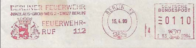
Die West-Berliner Feuerwehr führte über Jahrzehnte ihr Logo im Absenderfreistempel.

mit seiner Brandlöschrüstung auf der einen Fahrzeugseite und der Ausrüstung für technische Hilfeleistung auf der anderen Fahrzeugseite unter Einhaltung aller genormten Außenmaße. Dieses Fahrzeug musste wegen des andauernden Personal-mangels für eine kleinere Personalzahl ausgelegt werden, weil geeignete Bewerber immer schwerer zu gewinnen sind. Mit Hilfe neuer technischer Entwicklungen bewältigt es die Masse der anfallenden entsprechenden Einsatzfälle, im Wesentlichen natürlich jenseits der Rettungseinsätze.