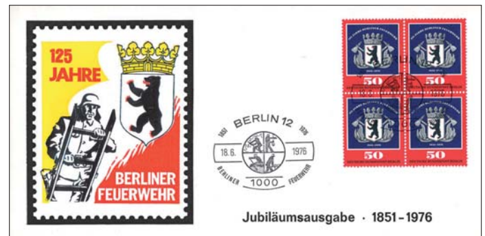
Die LPD Berlin würdigte 125 Jahre Berliner Feuerwehr (MiNr. 523) mit dem Logo der West-Berliner Feuerwehr, hier auf Sonderumschlag mit einem feuerwehrbezogenen Sonderstempel.

Im Westen änderte sich im Feuerwehrwesen durch den hinzugekommenen Rettungsdienst die Fahrzeugausstattung zum Vier-Fahrzeug-Zug mit Rettungswagen. Hier wurde der Löschzug Löschfahrzeug, Tanklöschfahrzeug, Drehleiter und Rettungswagen der Normalzug. In West-Berlin wurde die Wache in der Borussiastraße für diese Ausrüstungszeit typisch. Allerdings hatte der hinzugekommene Rettungsdienst weitreichende Folgen, weil dessen Einsatzzahlen die Brandbekämpfung nach und nach überlagerten und auch die Ausbildung beherrschten. Dennoch ging aus dieser Zeit die Erfindung des blauen Rundumblicklichts aus der West-Berliner Feuerwehr um die Welt.