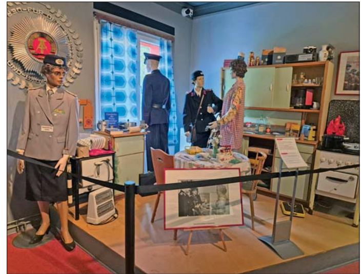
Das Feuerwehrmuseum bezieht auch die Geschichte der Ost-Berliner Feuerwehr, Teil der Volkspolizei, mit ein.

Da hier die Feuerwehr in die Polizei eingegliedert wurde, gehörten dazu auch völlig andere Wachgebäude, zum Beispiel das in der Littenstraße. Die Erfindung des Höhenrettungsdienstes bei der Ost-Berliner Feuerwehr ging aus dieser Zeit um die Welt.