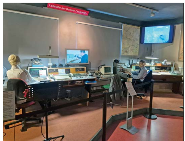
Blick ins Feuerwehrmuseum. Die Leitstelle Notrufzentrale nimmt täglich tausende von Meldungen entgegen!

Günter Strumpf, Feuerwehrmuseum Berlin Hans-Ulrich Schulz, Team Bephila (philat. überarbeitet)